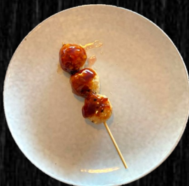
HJEMMELAVET KYLLINGE- BOLLER 28,-