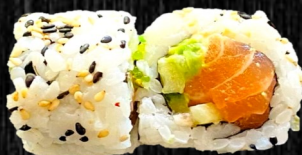
Spicy Laks m. chilimayo. Avocado, agurk og sesam 80,-