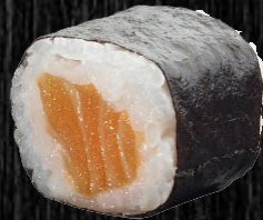
Laks m. hvidløg 42,-