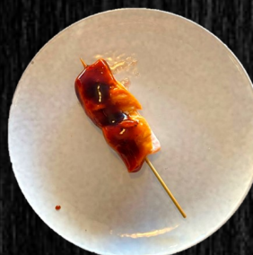
LAKS I TERIYAKI 30,-

Bestil Take-away via vores hjemmeside og få 10% rabat ved brug af rabatkoden HANAFOD