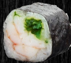
Reje m. koriander 42,-