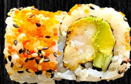
Paneret Reje m. chilimayo, se- sam, avo og agurk 85,-