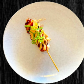
KYLLING M. CHILI OG FORÅRSLØG 30,-