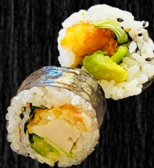
Paneret Kylling 75,- m. sesam, avo og agurk