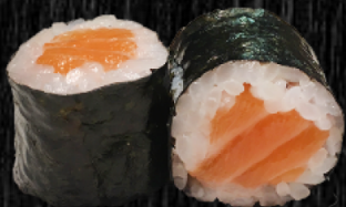
Laks m. chili- mayo 42,-