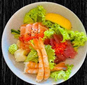
Mix Sashimi (12 stk)