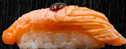
Grillet laks 40,-