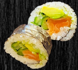
Laks 60,- m. basilikum, avo og agurk