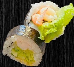
Krebsehale 60,- m. salat, chilimayo og avocado