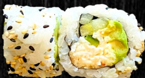
California m. Surimi, avo og agurk 80,-