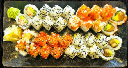
Uramaki Menu, 32 stk Uramaki: 8 California, 8 Orange, 8 Crispy Kylling, 8 Paneret reje 308,-