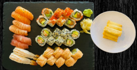
Favorit Menu, 38 stk Nigiri: 2 laks, 2 grillet laks, 2 tun, 2 reje Uramaki: 8 California, 8 Orange Kaburimaki: 8 Crazy + 6 Forårsruller 358,-