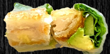
Kylling rispapir m. sesamdressing 80,-