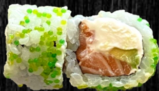
Phille Laks m. flødeost og avocado 85,-