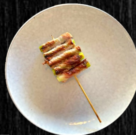
ASPARGES M. BACON 30,-