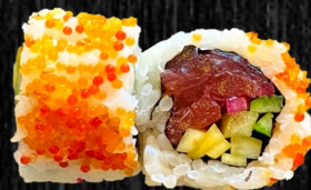
Tun Mango m. syltet løg, agurk og fiskerogn 85,-