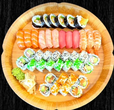
Triple Sushi Menu, 42 stk Nigiri: 3 laks, 3 grillet laks, 3 tun, 3 reje Uramaki: 8 California, 8 Orange, 8 Grøn Cali Futomaki: 6 Paneret reje 420,-