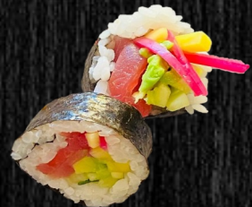
Tun 68,- m. mango, avo, syltet løg og agurk