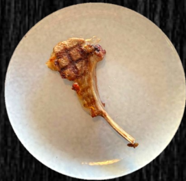
LAMME- KRONE 48,-