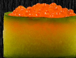
Gunkan Ørredrogn 45,-