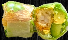
Paneret reje rispapir m. sesamdressing 80,-