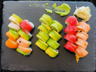
Kaburimaki Menu, 24 stk Kaburimaki: 4 Crazy, 4 Ginza, 8 Rainbow, 8 Dragon 348,-