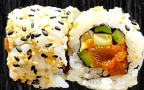
Spicy Tun m. chilimix og forårsløg, agurk og fiskerogn 85,-