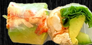
Krebsehale rispapir m. sesamdressing 80,-