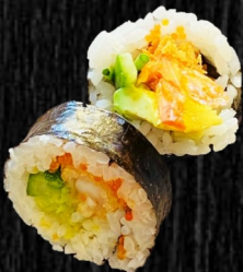
Paneret reje 75,- m. forårsløg, flyvefiske- rogn, avo og agurk