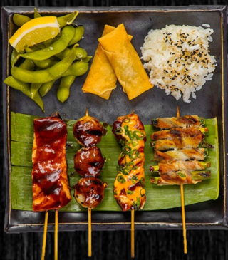
Yakitori Combo, 4 sticks

1 Kyllingebolle, 1 Kyllingebryst, 1 Asperges m. bacon, 1 Grillet laks + 2 Forårsruller, Edamamebønner og Ris