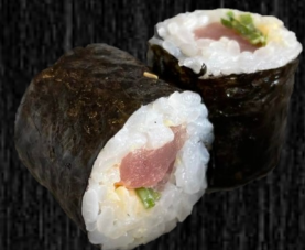
Tun m. chilimayo 42,-