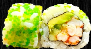
Grøn California Krebsehale, Koriander, Wasabi, fiskerogn, avo og agurk 80,-