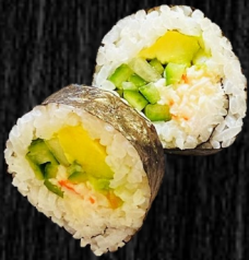
California 60,- m. avo og agurk