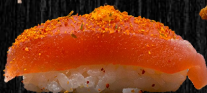
Spicy Tun 40,-

Bestil Take-away via vores hjemmeside og få 10% rabat ved brug af rabatkoden HANAFOD