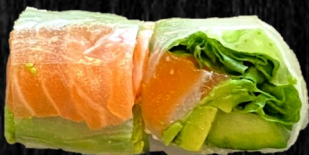
Laks rispapir m. sesamdressing 80,-