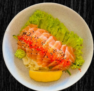
Laks Sashimi (7 stk) 90,-