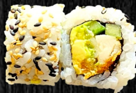
Paneret Kylling m. chilimayo og avocado 85,-

Bestil Take-away via vores hjemmeside og få 10% rabat ved brug af rabatkoden HANAFOD