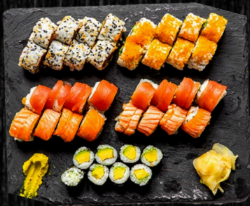
Twosome Menu, 40 stk Kaburimaki: 8 Ginza Dream, 8 Crazy Uramaki: 8 Orange, 8 Spicy Tun Hosomaki: 8 Avocado 400,-