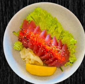
Tun Sashimi (7 stk) 100,-