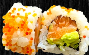
Orange Laks m. orange rogn, avocado og agurk 80,-