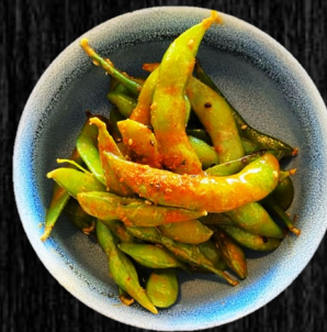
HUSETS EDA- MAMEBØNNER 38,-