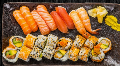
Pair Menu, 24 stk

Nigiri: 2 laks, 2 grillet laks, 2 tun, 2 reje Uramaki: 4 California, 4 Orange, 8 Paneret reje