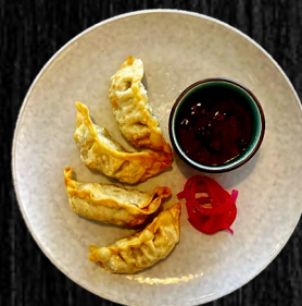
GYOZA M. KYLING 50,-