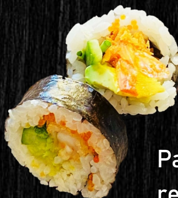
Paneret reje 68,-