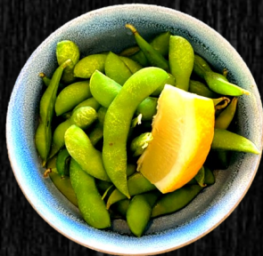
EDAMAME- BØNNER 30,-