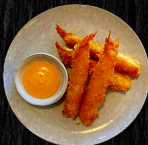
CRISPY REJER 4 STK. 60,-