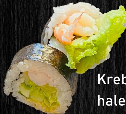
Krebse- hale 60,-