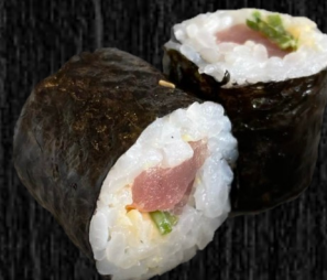
Tun m. chilimayo