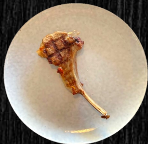
LAMME- KRONE 48,-