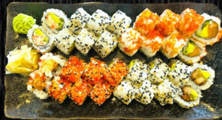
Uramaki Menu, 32 stk

Uramaki: 8 California, 8 Orange, 8 Crispy Kylling, 8 Paneret reje