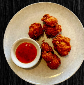
CRISPY KYLING 50,-