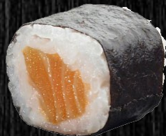
Laks m. hvidløg