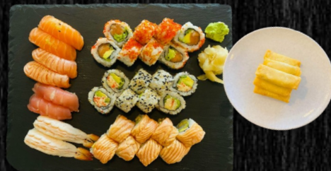
Favorit Menu, 38 stk

Nigiri: 2 laks, 2 grillet laks, 2 tun, 2 reje Uramaki: 8 California, 8 Orange Kaburimaki: 8 Crazy + 6 Forårsruller