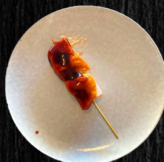
LAKS I TERIYAKI 30,-