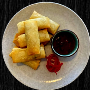
MINI FORÅRS- RULLER 8 STK. 50,-