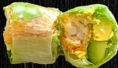
Paneret reje rispapir