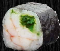
Reje m. koriander