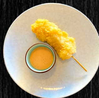
PANERET KYLLING 28,-