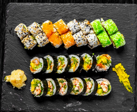
Maki Combo Menu

Uramaki: 4 California, 4 Orange, 4 Grøn Cali, 4 Spicy Tun Futomaki: 6 Paneret reje, 6 Reje