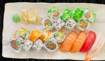
Hana Sushi Menu, 20 stk