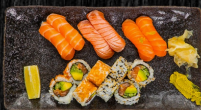
Laks Menu, 14 stk

Nigiri: 2 laks, 2 grillet laks, 2 laks m. hvidløg Uramaki: 4 Orange, 4 Spicy